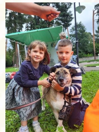
Фестиваль «Рок в защиту животных»